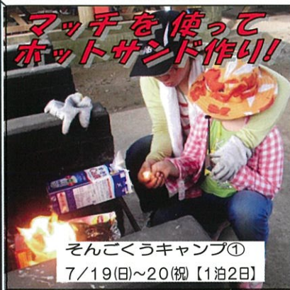
そんごくうキャンプ① 7/19(日)~20(祝)【1泊2日】