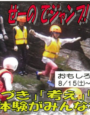
おもしろ村キャンプ 8/15(土)~17(月)【2泊3日】