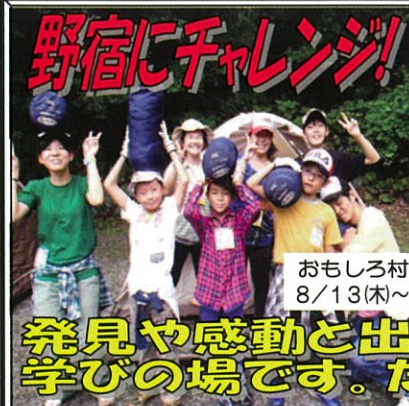
おもしろ村キャンプ上級編 8/13(木)~17(月)【4泊5日】