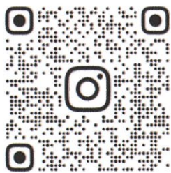
そんごくうキャンプ② 7/25(土)~26(日)【1泊2日】