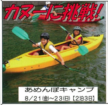
あめんぼキャンプ 8/21(金)~23(日)【2泊3日】