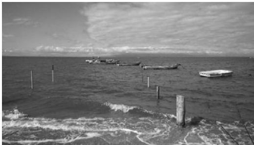
写真 1 ラムサール登録地「満潮の荒尾干潟」