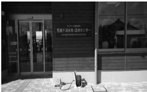
写真 3 荒尾干潟水鳥・湿地センター