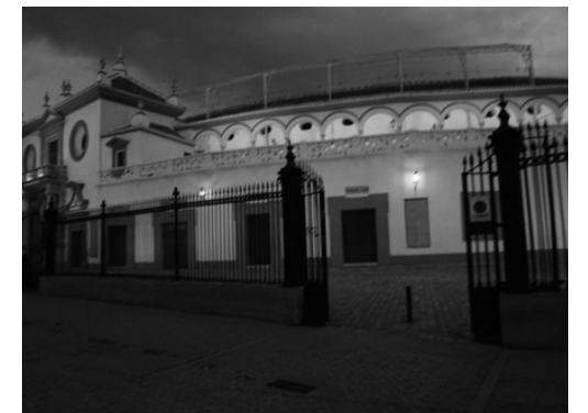
セビージャ市のリアル・マエストランサ闘牛場の外観。闘牛博物館も併設されている。

部アストゥリアス自治州の州都) には闘牛を禁止する法的根拠は存在しないが、ブエナビスタ闘牛場は老朽化のため行政の使用許可が下りず、事実上開催が見送られている。闘牛場の改修工事は 2026 年開始予定であるものの、現市長(国民党、PP) は任期中の闘牛復活はないと明言している。闘牛復活を強く主張しているのは右派政党 Vox 系勢力のみであり、ここには闘牛