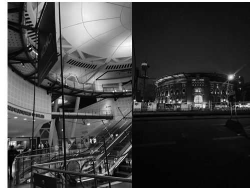
写真左は、利活用されているバルセローナ市のラス・アレナス闘牛場の現在の内観でショッピングモールとして賑わっている。一方、写真右は、闘牛場の形を活かした作りとなっている外観でネオンによって装飾されている。

けではない。例えば、闘牛観覧の年齢制限の導入（14歳以上）等は、制度的に導入済みである 16 。要するに、TCは、憲法第46条に由来する「スペインの諸民族」の文化的多様性の尊重という理念にも言及し、全国的伝統と自治州固有の文化は相互補完的關係にあるとして、