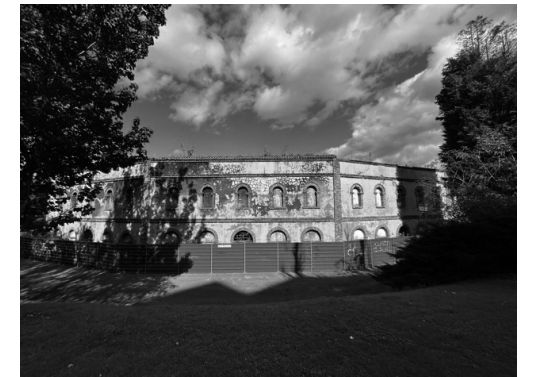
オビエド市から使用許可が下りないまま閉鎖された闘牛場外観。雨の多い地方でもあるため老朽化のスピードが早い。