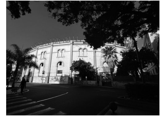
現在使用されなくなったカナリア諸島最大の都市 サンタクルス・デ・テネリフェ市にある闘牛場の外観。

カナリア諸島自治州における闘牛の廃止は、スペイン国内における動物倫理と地域文化の関係を考察するうえで、きわめて示唆的な事