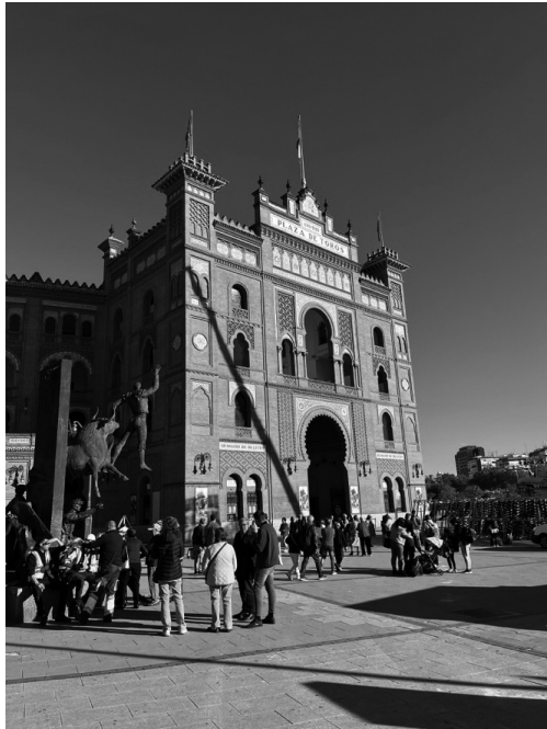
マドリッド市にあるラス・ベントス闘牛場。 スペイン最大級の闘牛場であり、 連日多くの観光客が訪れる。