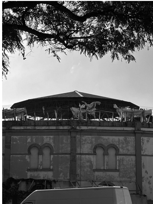
外からみるテネリフェ市の闘牛場内に設置された傘状の屋根。改修計画の遅れから老朽化が目立つ。

闘牛廃止の象徴的事例としてしばしば言及されるのが、サンタ・クルス・デ・テネリフェ市