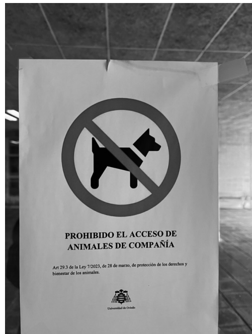
オビエド大学クリストキャンパスに貼られた構内掲示物。改正動物福祉保護法が成立し、教育機関も対応を迫られている 25 。

ている 23 。これは動物の適切な保護のみならず、公衆衛生や生物多様性の観点からも課題を生じさせる。こうした状況を受け、2020年の欧州議会決議は、スペインがEU域内のペット取引の主要な原産国・仕向け国の一つであることを踏まえ、違法取引対策の強化を求めた。具体的には、犬猫の登録義務制度の整備、大規模商業繁殖施設の定義、虐待罰則の強化、里親制度の促進、動物保護施設やNGOへの財政的・物的支援の充実などが提案されている 24 。これらは、動物福祉を社会的責任として制度化する方