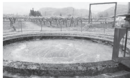
果樹園の中の栗本堰円形分水工（福島市） 2016.5.9