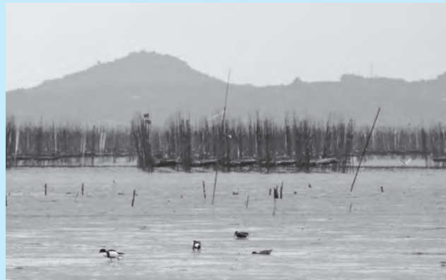
夕暮れの東よか干潟とツクシガモ。奥は海苔養殖場 (2015年11月28日)