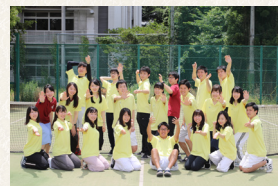
③クラブ・サークル集合