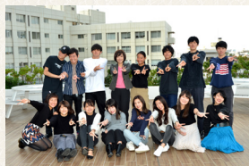
②ゼミ・研究室集合