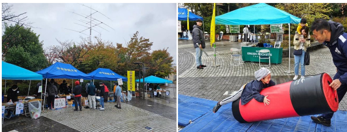
写真2 当日のマルシェの様子

ここで我々は、学生が地域活動の担い手としてどう思われているかを検証するため、来場者に対して本学の学生や地域連携カイギの取り組みなどに関するアンケート調査を実施した。回答への協力を得られたのは20名と少なかったが、貴重な意見が得られた。例えば、「我孫子の活性化に必要なことは何か？」という問いには、「若い人々との交流」「公校民の連携」などの回答があった。また、こうした企画を継続的に求める声も多く、理由としては「若者たちが街を盛り上げてくれるのが嬉しいから」「学生の取り組みに協力したい」などが寄せられた。母数の少なさは否めないものの、学生による地域活動に協力的であり、歓迎するような反応が見られた。